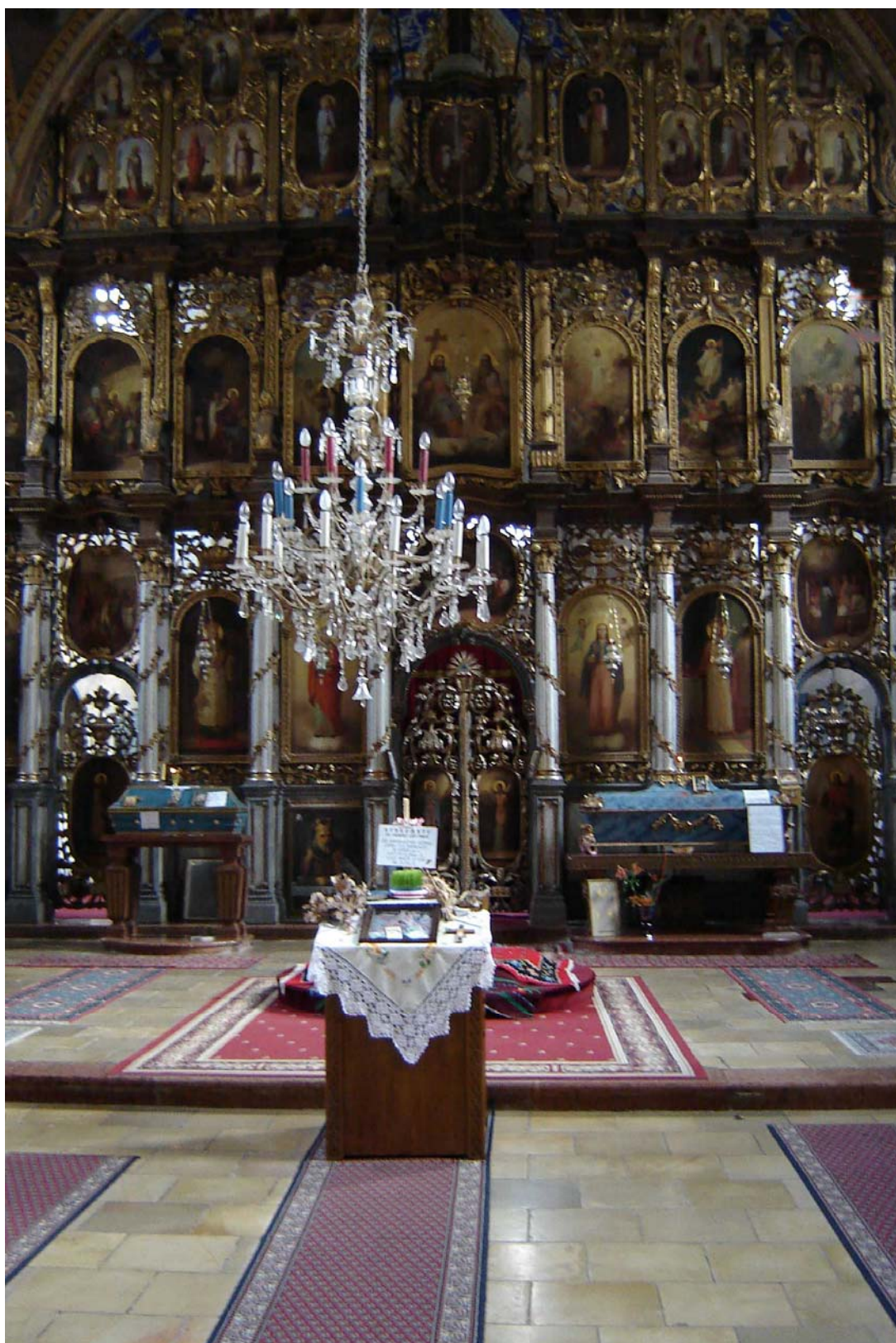
Иконостас Храма Вазнесења Господњег, фрушкогорског манастира Раваница